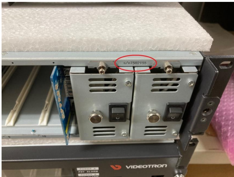
Vbus-70C/Vbus-70C-01 のシリアル番号のシール位置